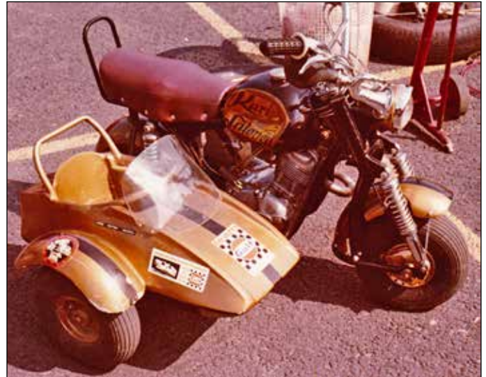
Lopen Sepän varikkomopo.

Marcello-ralli järjestettiin ensimmäisenä kansallisena ennakolta tutustuttavana rallina vuoden 1983 joulukuussa.